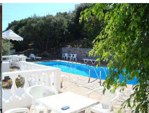
θέα στην πισίνα