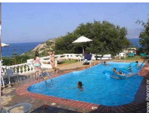
θέα στην πισίνα