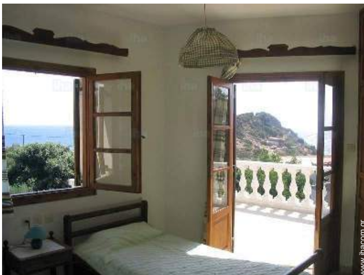
άποψη της ιδιοκτησίας