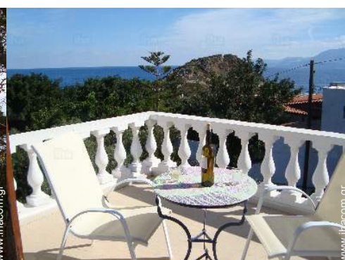
άποψη από το μπαλκόνι