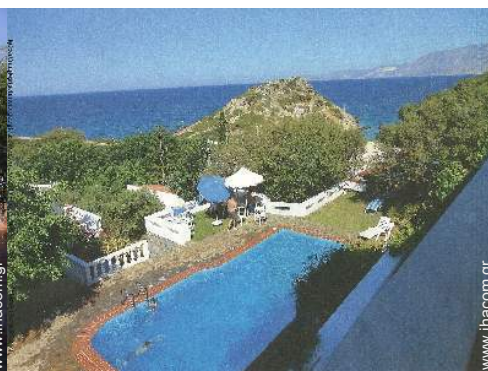
θέα στην πισίνα