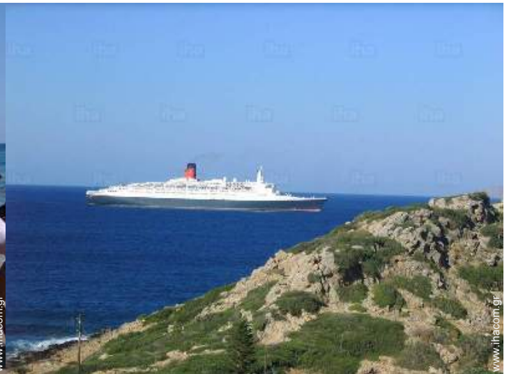
άποψη από το μπαλκόνι