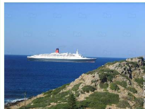
άποψη από το μπαλκόνι