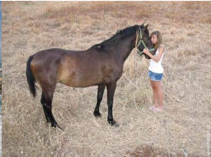
βόλτα με άλογο