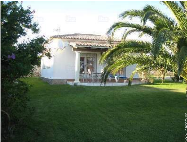
άποψη της ιδιοκτησίας