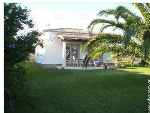
άποψη της ιδιοκτησίας