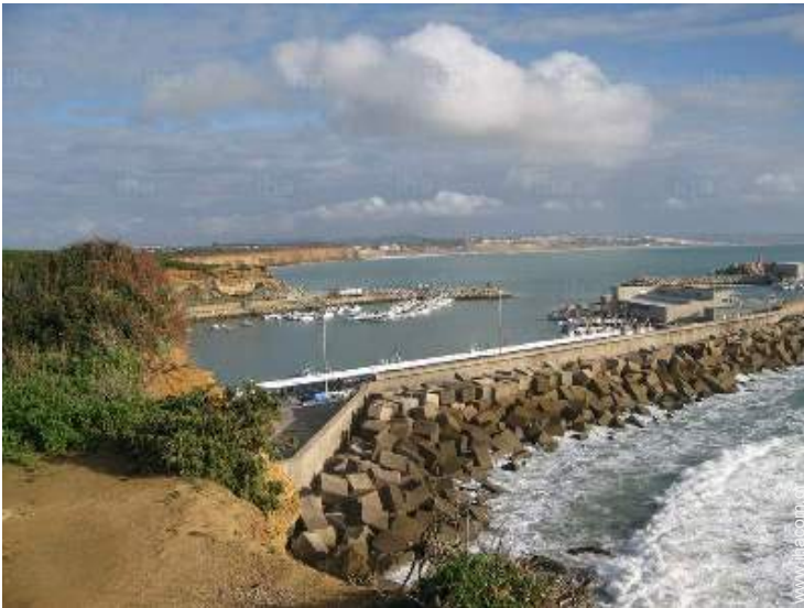
θάλασσα / ωκεανός