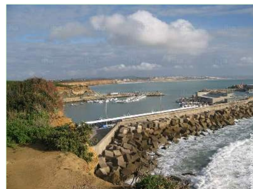
θάλασσα / ωκεανός