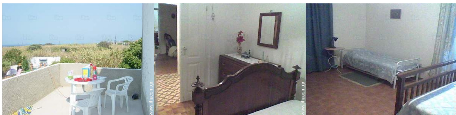
χώρος για ηλιοθεραπεία