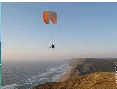
αλεξίπτωτο πλαγιάς (παραπέντε)