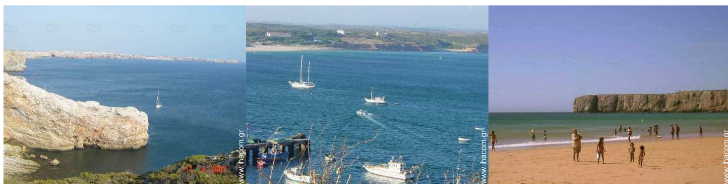
Αξιοθέατα και χαλάρωση