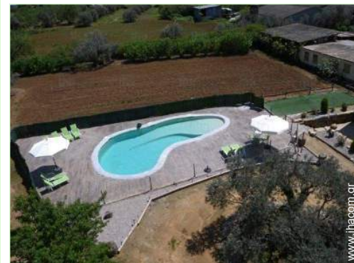
θέα στην πισίνα

Κέντρο χωριού 1km Στάση / σταθμός λεωφορείου 1,5km Αρτοποιείο 1km Μικρά καταστήματα 2,5km Κομμωτήριο Ταχυδρομείο 2km Φαρμακείο 2km Νοσοκομείο 5km Εξωτερικό ιατρείο 1,5km