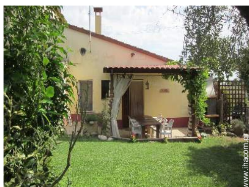
άποψη από το αίθριο