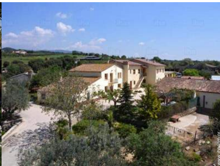
άποψη από αέρος