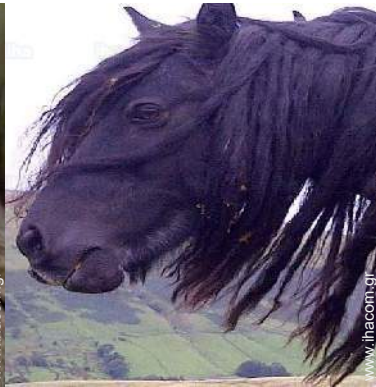
ιπποειδή (π.χ. άλογα)