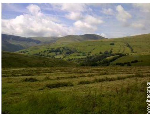
θέα στην εξοχή