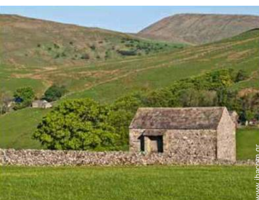
άποψη από τον κήπο/πάρκο