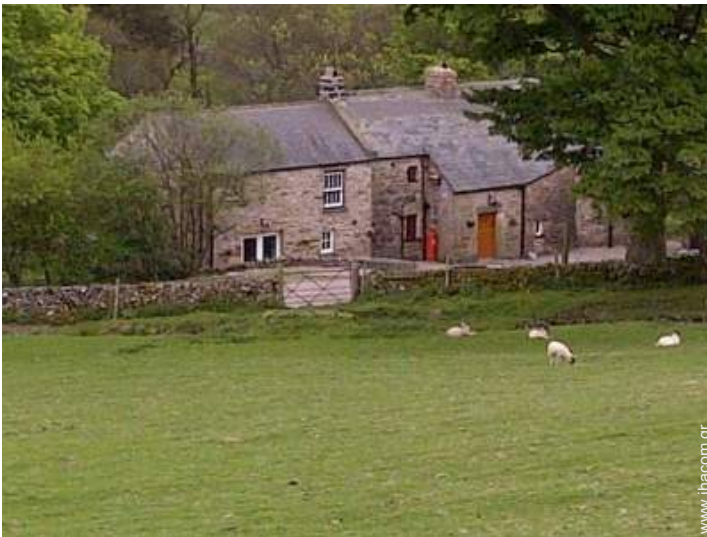
θέα σε χωράφια