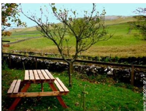
άποψη από τον κήπο/πάρκο