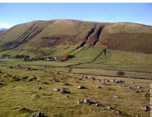
θέα στην εξοχή