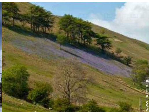
άποψη από το καθιστικό