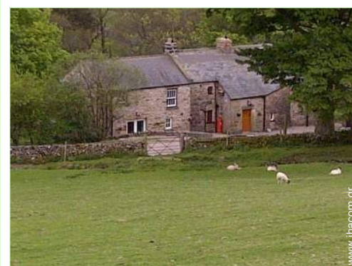
θέα σε χωράφια

Κέντρο χωριού 5km Κέντρο πόλης 10km Ενοικίαση ποδηλάτου/MTB 10km Αρτοποιείο 10km Μικρά καταστήματα 10km Σούπερ μάρκετ 10km Κομμωτήριο 10km Ταχυδρομείο 10km Τράπεζα 10km Αυτόματο μηχάνημα χαρτονομισμάτων 10km Φαρμακείο 10km Ιατρός 10km Νοσοκομείο 30km Εξωτερικό ιατρείο 10km