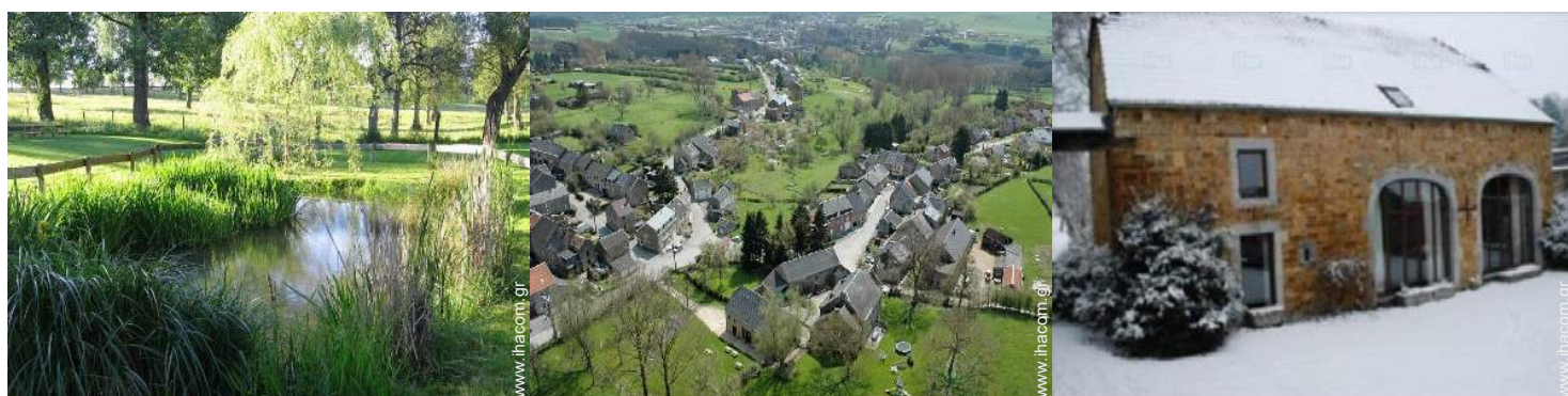
θέα σε κήπο/πάρκο