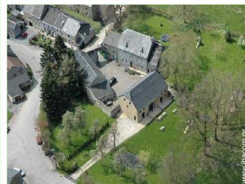
άποψη από αέρος