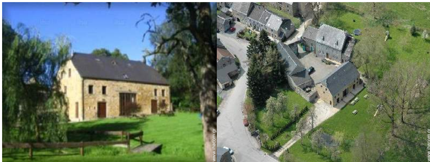
άποψη από αέρος