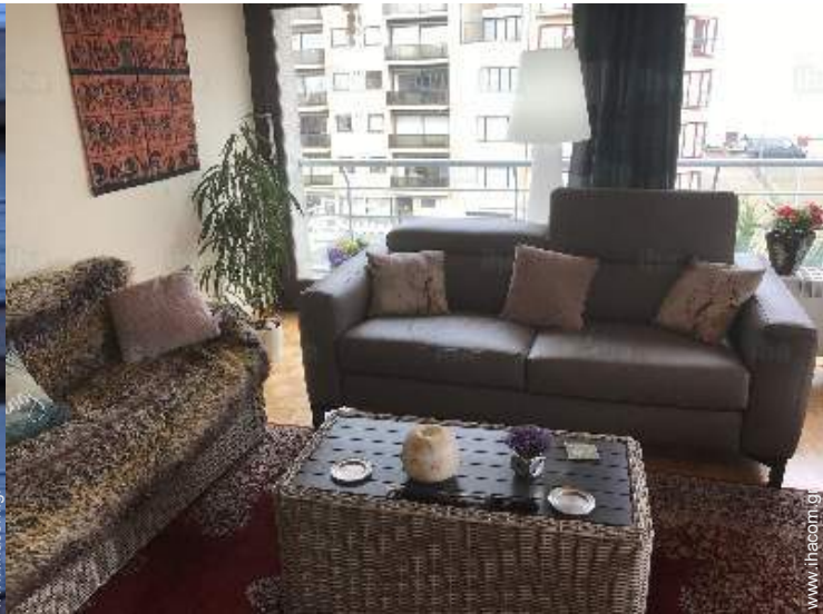
Εσωτερική διαρρύθμιση και ανέσεις