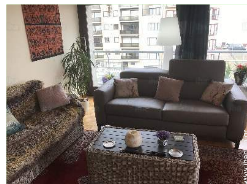
Εσωτερική διαρρύθμιση και ανέσεις