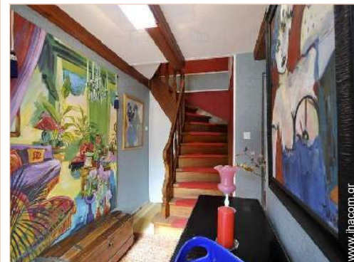
Εσωτερική διαρρύθμιση και ανέσεις