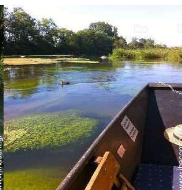
εκδρομές με σκάφος