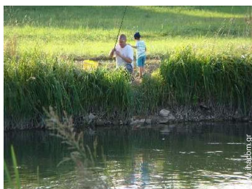
κοντά σε καλοκαιρινά σπορ