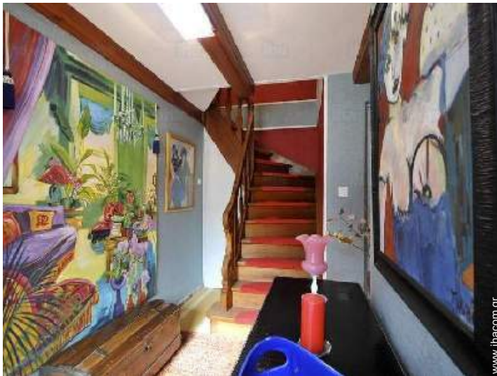
Εσωτερική διαρρύθμιση και ανέσεις