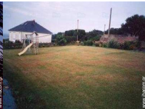
άποψη από τον κήπο/πάρκο