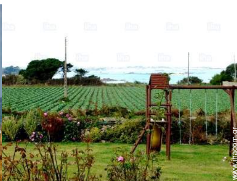
άποψη από τον κήπο/πάρκο