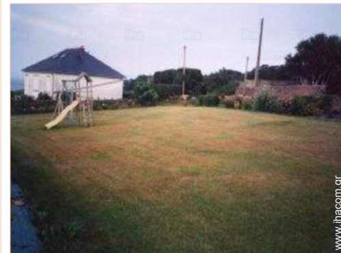
άποψη από τον κήπο/πάρκο

Θερμαινόμενη πισίνα 10km Θάλασσα / ωκεανός 300m Αμμώδης παραλία 300m Παραλία με βότσαλα 300m Βραχώδης παραλία 300m Κοινόχρηστη πισίνα 10km Κοινόχρηστο γήπεδο τένις 15km Διαδρομή γκολφ 9 οπών 30km Διαδρομή γκολφ 18 οπών 30km Κέντρο θαλάσσιων σπορ 10km Απόκρημη ακτή 15km Ποτάμι 10km Δάσος 10km Μαρίνα 10km Τάκι εισόδου σκάφους στο νερό 300m