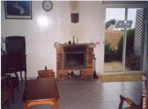
άποψη από το σαλόνι