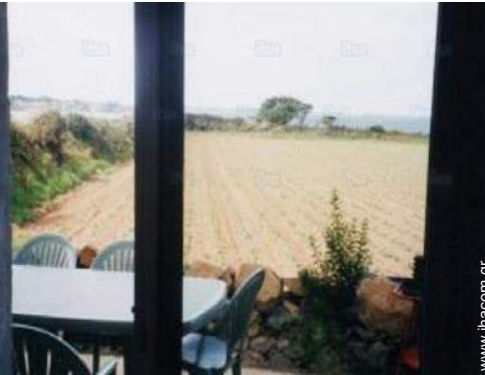
άποψη από την ταράτσα