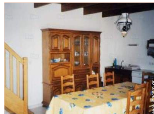
άποψη από την τραπεζαρία

Μπάρμπεκιου, τραπέζι(-α) κήπου, 8 καρέκλα (-ες) κήπου, σαλόνι κήπου, 4 σεζλόγκ, 4 ξαπλώστρες, παιδική κούνια, παιδικό παιχνίδι-αναρρίχηση