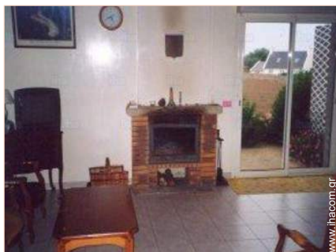
άποψη από το σαλόνι