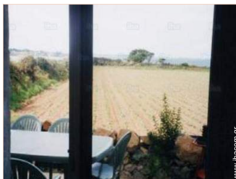
άποψη από την ταράτσα

Παιδιά ευπρόσδεκτα Κατοικίδια ζώα δεκτά Κάλυψη δικτύου κινητής τηλεφωνίας, επιθυμητή μεταφορά προσώπων Νερό : ζεστό/κρύο Παροχή τάσης : 220-240V / 50Hz Τροφοδοσία : κεντρικό ηλ. κύκλωμα