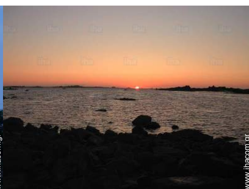
θέα σε ηλιοβασίλεμα