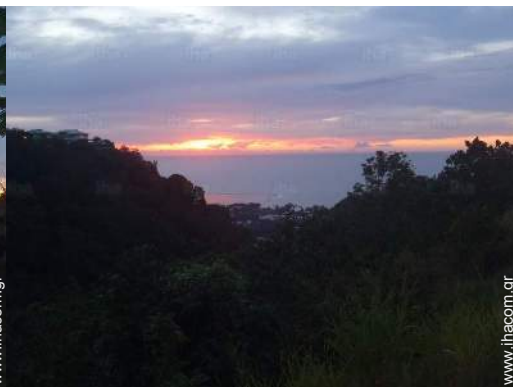
θέα στον ωκεανό