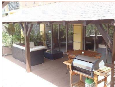
άποψη από την ταράτσα