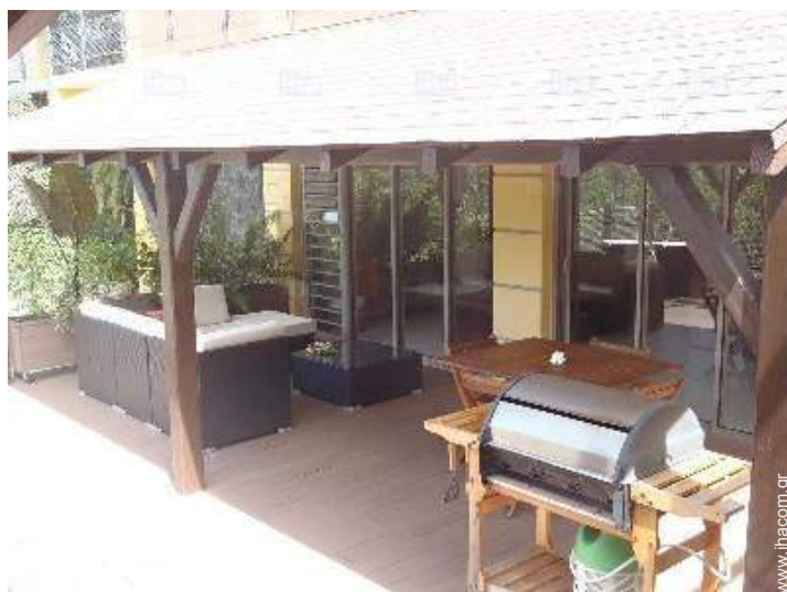
άποψη από την ταράτσα