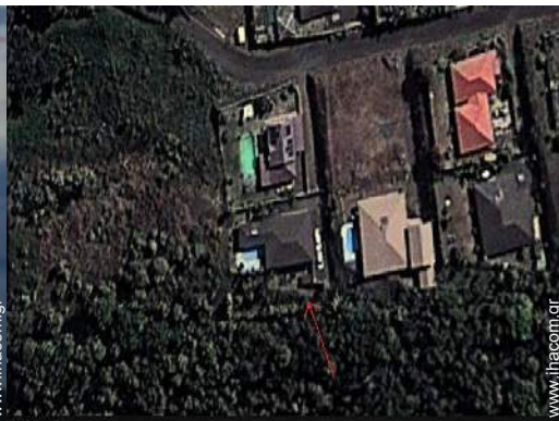
άποψη από αέρος