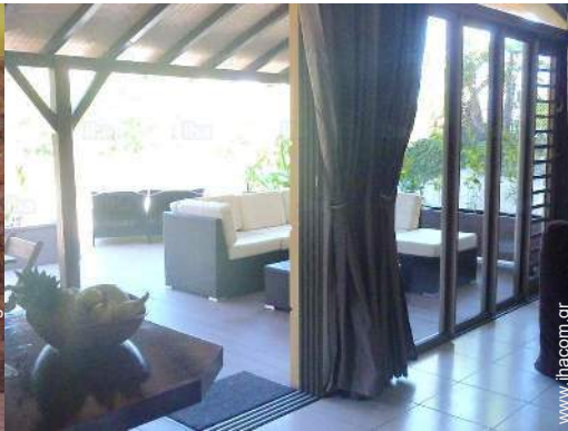
άποψη από το διαμέρισμα