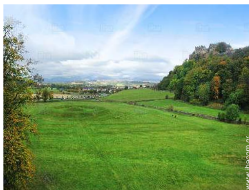
άποψη της ιδιοκτησίας