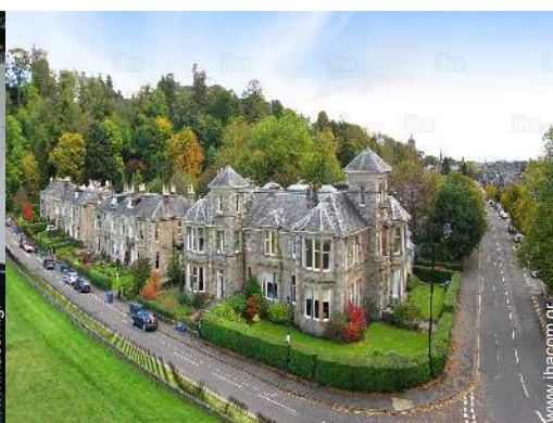
άποψη από αέρος