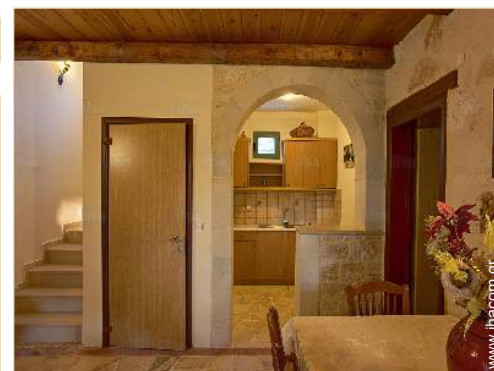
Εσωτερική διαρρύθμιση και ανέσεις