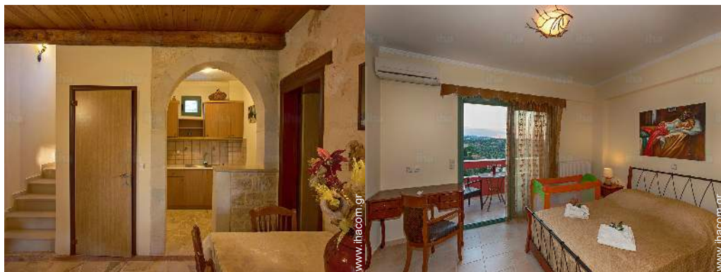
Εσωτερική διαρρύθμιση και ανέσεις