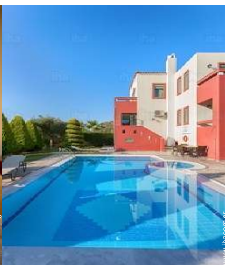
θέα στην πισίνα