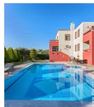
θέα στην πισίνα

Κέντρο χωριού 800m Κέντρο πόλης 5km Ενοικίαση ποδηλάτου/MTB 3km Ενοικίαση μηχανών / σκούτερ 3km Ενοικίαση αυτοκινήτου 3km Αρτοποιείο 2km Μικρά καταστήματα 3km Σούπερ μάρκετ 3km Κομμωτήριο 5km Internet καφέ 5km Τράπεζα 5km Αυτόματο μηχάνημα χαρτονομισμάτων 4km Φαρμακείο 2km Ιατρός 4km Νοσοκομείο 5km