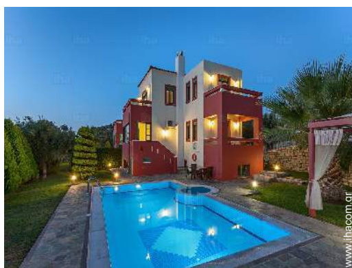
με σύστημα φωτισμού