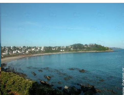
άποψη από νότο