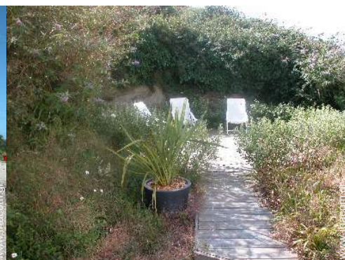
χώρος για ηλιοθεραπεία