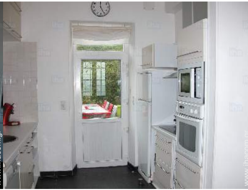
κουζίνα αμερικάνικου στιλ