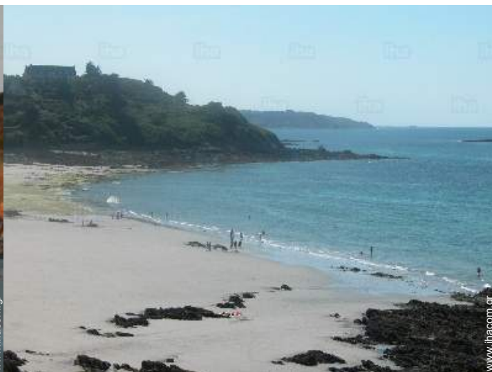
άποψη από το σπίτι