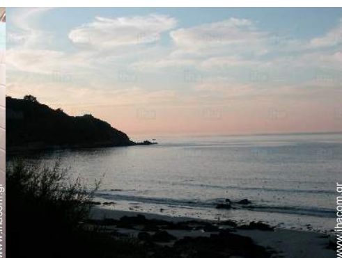
θέα σε ηλιοβασίλεμα