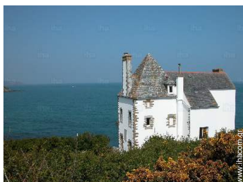
θέα στη θάλασσα