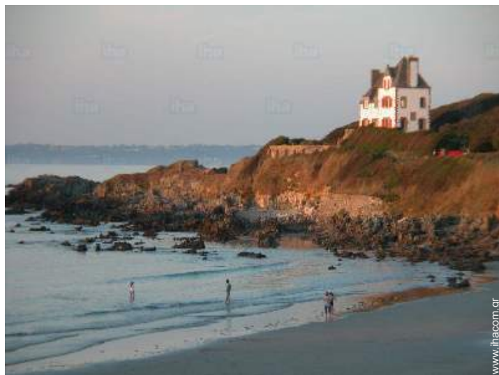
άπευθείας πρόσβαση στην παραλία