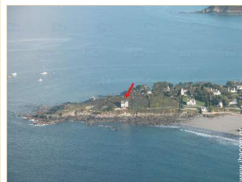
άποψη από αέρος

Κέντρο χωριού 500m Στάση / σταθμός λεωφορείου 300m Ενοικίαση αυτοκινήτου 20km Αρτοποιείο 300m Μικρά καταστήματα 300m Σούπερ μάρκετ 5km Κομμωτήριο 500m Ταχυδρομείο 500m Αυτόματο μηχάνημα χαρτονομισμάτων 500m Φαρμακείο 500m Ιατρός 5km Νοσοκομείο 20km