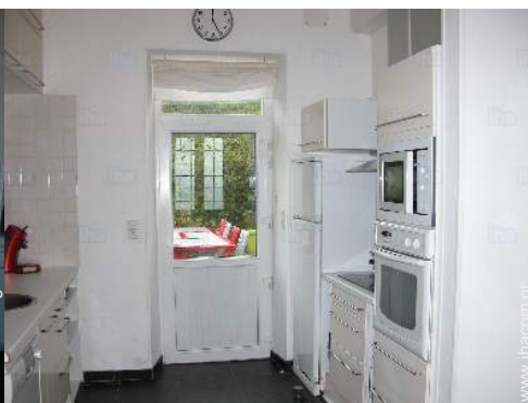
κουζίνα αμερικάνικου στιλ