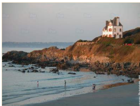
απευθείας πρόσβαση στην παραλία