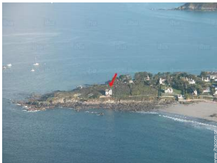
άποψη από αέρος