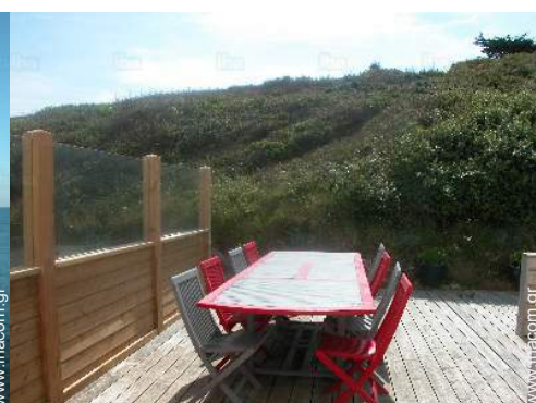
άποψη από την κουζίνα