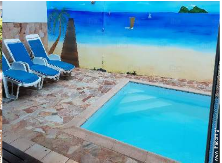
άποψη από την κλειστή ταράτσα