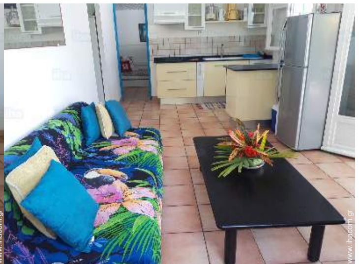
άποψη από το σαλόνι