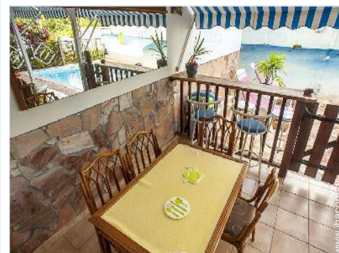
άποψη από το δωμάτιο