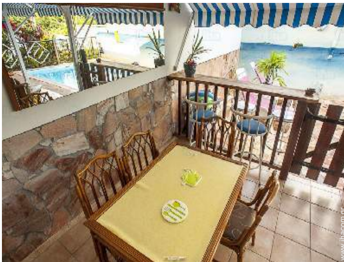
άποψη από το δωμάτιο