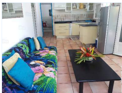
άποψη από το σαλόνι