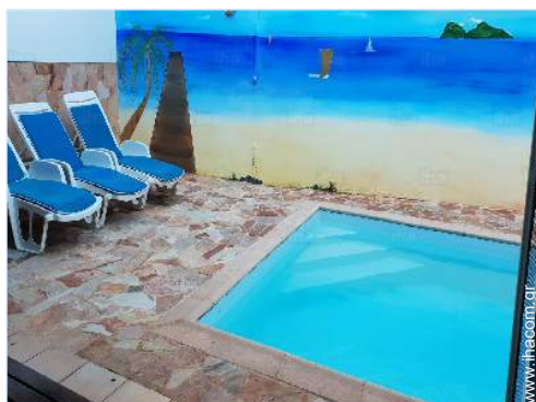
άποψη από την κλειστή ταράτσα