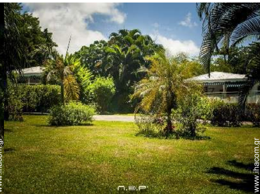
άποψη από τον κήπο/πάρκο