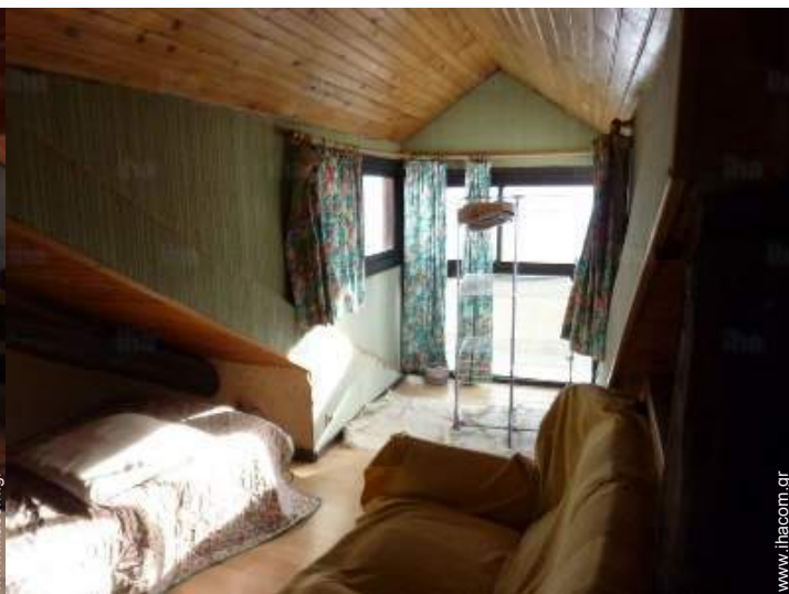
γωνία για τον ύπνο