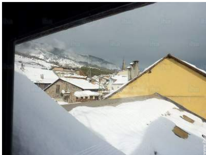
άποψη της ιδιοκτησίας