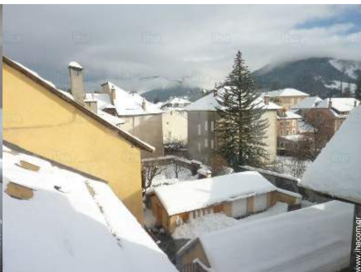
άποψη της ιδιοκτησίας