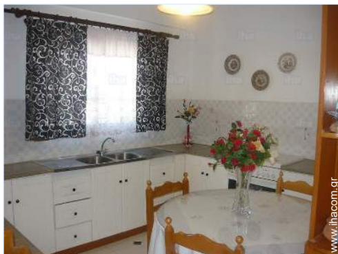
άποψη από την κουζίνα