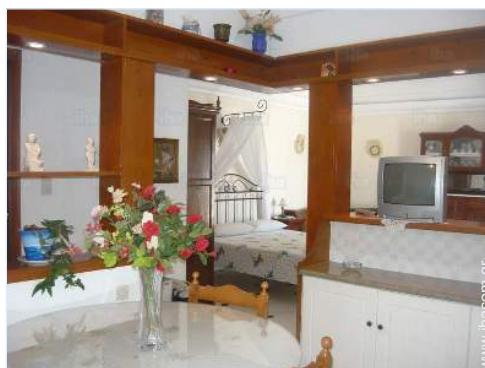
άποψη από την κουζίνα

Παιδιά ευπρόσδεκτα Κάλυψη δικτύου κινητής τηλεφωνίας, επιθυμητή μεταφορά προσώπων Νερό : ζεστό/κρύο, μη πόσιμο νερό Παροχή τάσης : 220-240V / 50Hz Τροφοδοσία : κεντρικό ηλ. κύκλωμα