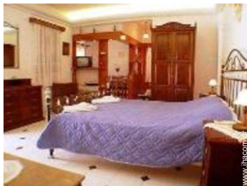
άποψη από το διαμέρισμα