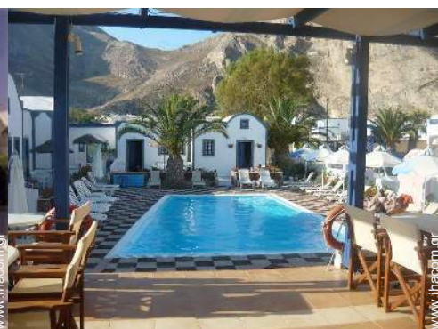
θέα στην πισίνα