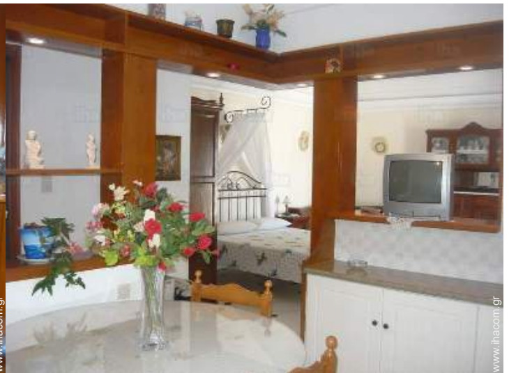
άποψη από την κουζίνα