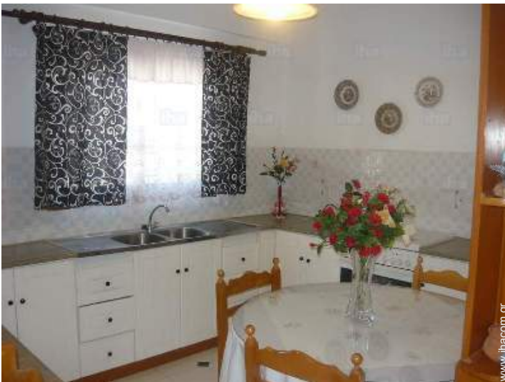
άποψη από την κουζίνα