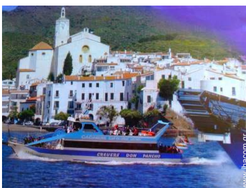
κοντά σε δραστηριότητες αναψυχής