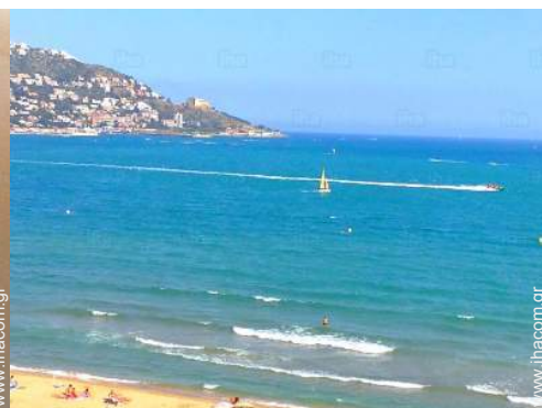
άποψη από την ταράτσα