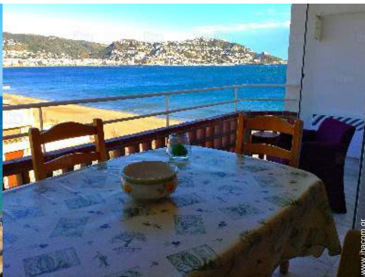
άποψη από το διαμέρισμα