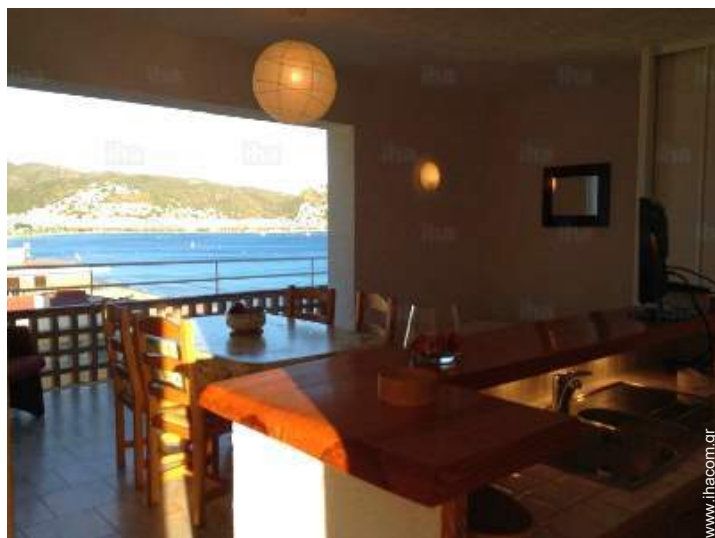
άποψη από το διαμέρισμα