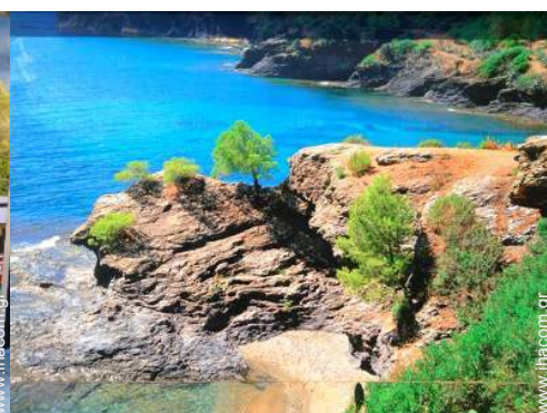
κοντά σε λουτρά