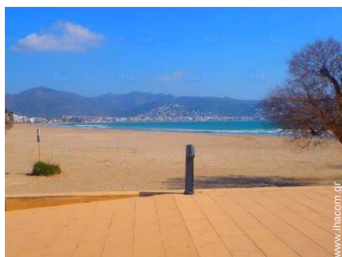
απευθείας πρόσβαση στην παραλία