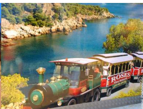
κοντά σε δραστηριότητες αναψυχής