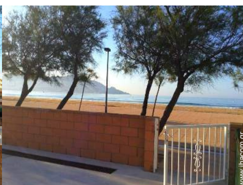
απευθείας πρόσβαση στην παραλία