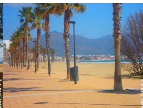
θέα στη θάλασσα