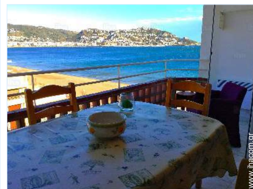
άποψη από το διαμέρισμα