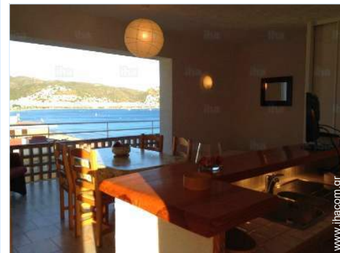
άποψη από το διαμέρισμα

Θάλασσα / ωκεανός <50m Αμμώδης παραλία <50m Παραλία γυμνιστών 4km