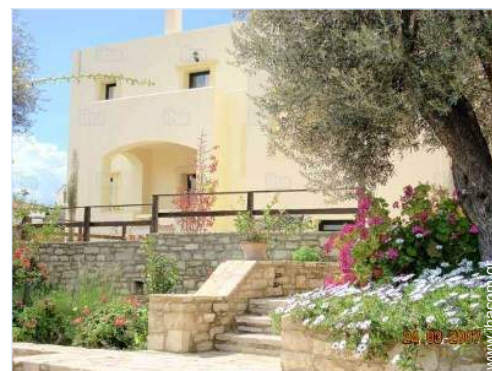
άποψη της ιδιοκτησίας