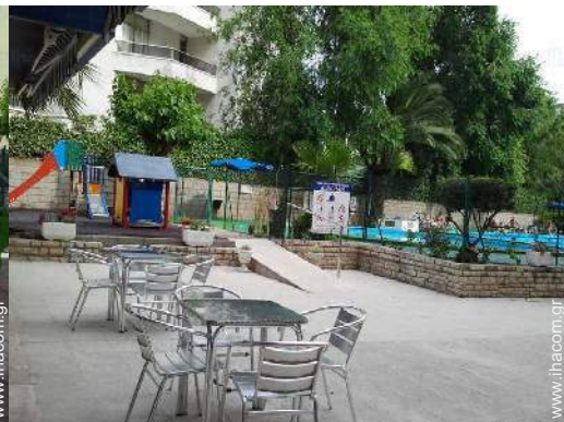
επίπλωση εξωτερικού χώρου