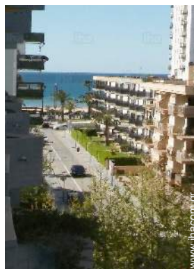
άποψη από την κλειστή ταράτσα