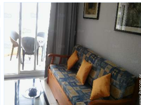
καναπές-κρεβάτι(-α) για 2 άτομα

Τραπέζι(-α) κήπου, > 30 καρέκλα(-ες) κήπου, ομπρέλα ήλιου, σαλόνι κήπου, > 30 ξαπλώστρες, κούνια κήπου, παιδική κούνια, σκάμια με άμμο, εξωτερική ντουσιέρα