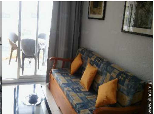
καναπές-κρεβάτι(-α) για 2 άτομα