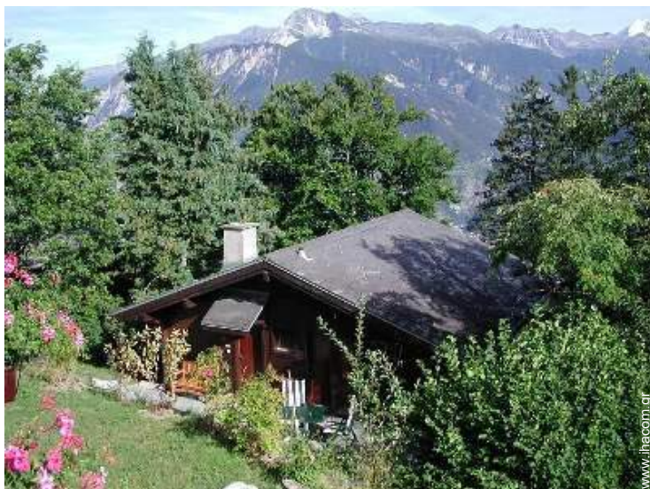
άποψη της ιδιοκτησίας