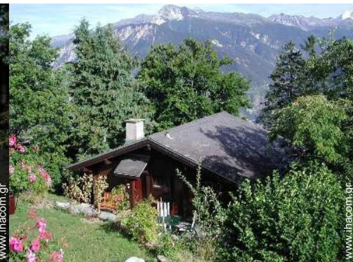
άποψη της ιδιοκτησίας