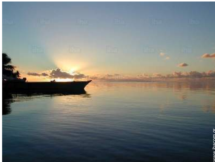
θέα σε ηλιοβασίλεμα