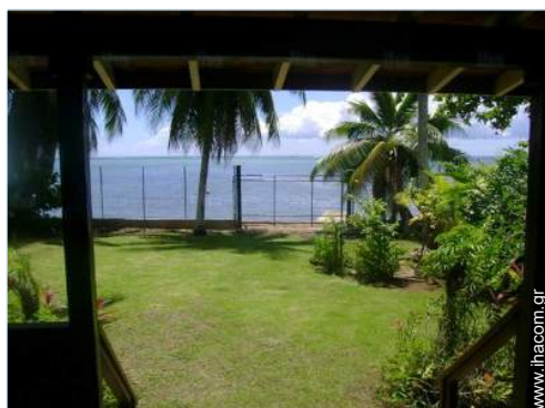
άποψη από την κλειστή ταράτσα