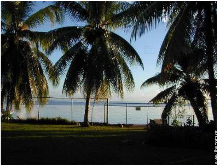
θέα στον ωκεανό