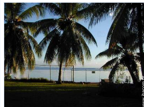
θέα στον ωκεανό