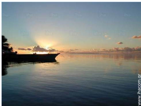
θέα σε ηλιοβασίλεμα