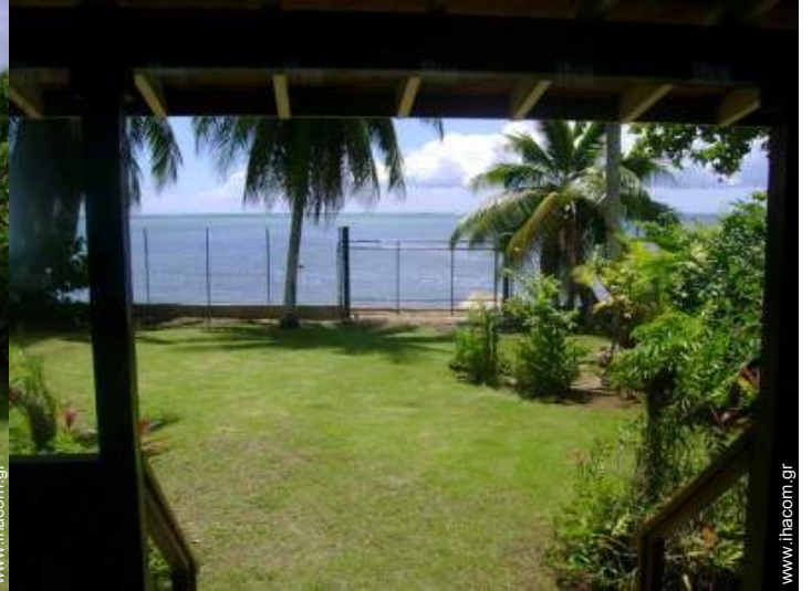
άποψη από την κλειστή ταράτσα