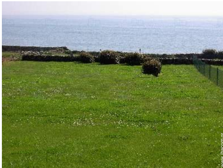
άποψη της ιδιοκτησίας