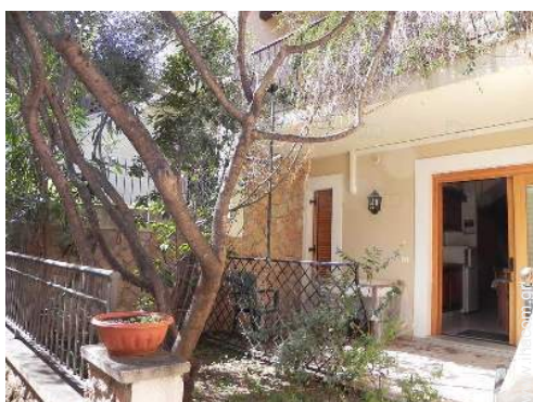
άποψη από τον κήπο/πάρκο