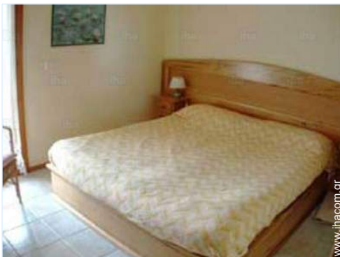
δωμάτιο του ιδιοκτήτη

" Ηλιακό θερμοσίφωνα, βεράντα με θέα στη θάλασσα, στο κέντρο, 150 μέτρα από την παραλία, λίγα βήματα από την αγορά, πιτσαρία, μπαρ, καταστήματα και φαρμακείο. Το σπίτι σε μια μικρή κατοικία 9 διαμερίσματα διαθέτει έναν ιδιωτικό κήπο με τραπέζια και καρέκλες, όπου μπορείτε να περάσετε ευχάριστες στιγμές. Χώρος στάθμευσης δεν είναι ένα πρόβλημα, και μπορείτε να ξεχάσετε για τη χρήση του αυτοκινήτου. Όλα βαθύ και άνετο. "