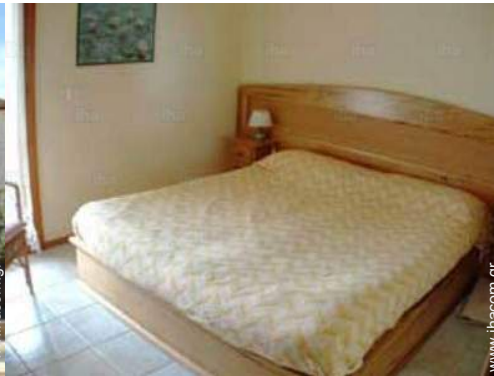
δωμάτιο του ιδιοκτήτη