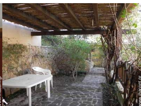
άποψη από τον κήπο/πάρκο