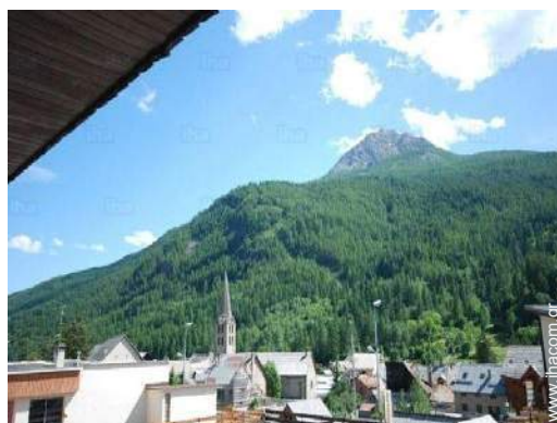
θέα στο βουνό