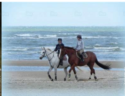
κοντά σε δραστηριότητες αναψυχής