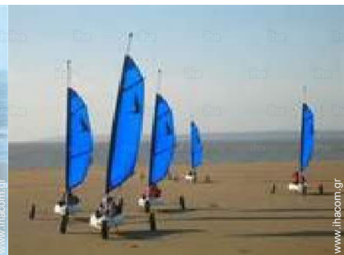
κοντά σε λουτρά