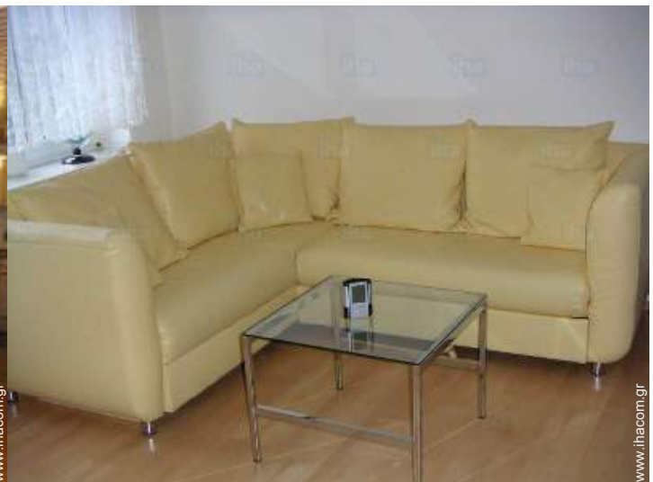
άποψη από το καθιστικό