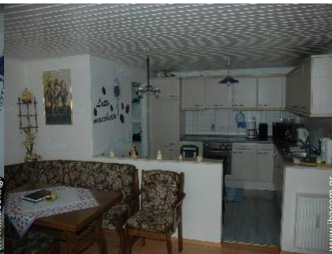
άποψη από την κουζίνα