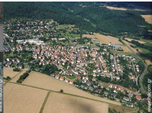
άποψη από αέρος