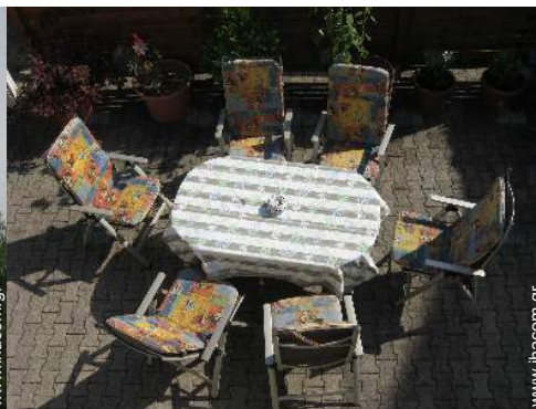
άποψη από την ταράτσα