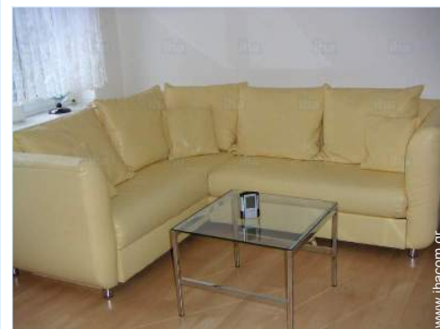
άποψη από το καθιστικό

Κέντρο χωριού Στάση / σταθμός λεωφορείου 200m Ενοικίαση ποδηλάτου/MTB 3km Ενοικίαση αυτοκινήτου Ενοικίαση λευκών ειδών/ υπηρεσίες πλυντηρίου 3km Αρτοποιείο 100m Μικρά καταστήματα 200m Σούπερ μάρκετ 3km Κομμωτήριο 300m Ταχυδρομείο Τράπεζα 3km Αυτόματο μηχάνημα χαρτονομισμάτων 2,5km Φαρμακείο 5km Ιατρός 3km Νοσοκομείο 5km Εξωτερικό ιατρείο 5km