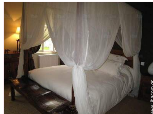
Το ενοικιαζόμενο δωμάτιο

Καμινάδα, τηλεόραση, επιτραπέζια παιχνίδια, συσκευή φαξ, υπολογιστής, καλωδιακή/δουροφορική τηλεόραση, πρόσβαση στο Internet, υψηλές ταχύτητες, Wi-Fi, πιστολάκι για τα μαλλιά, κουνουπιέρες στα παράθυρα, πλυντήριο ρούχων, στεγνωτήριο ρούχων, σίδερο, κεντρική θέρμανση, ηλεκτρική θέρμανση