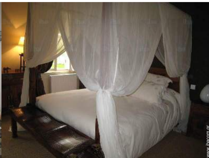
Το ενοικιαζόμενο δωμάτιο