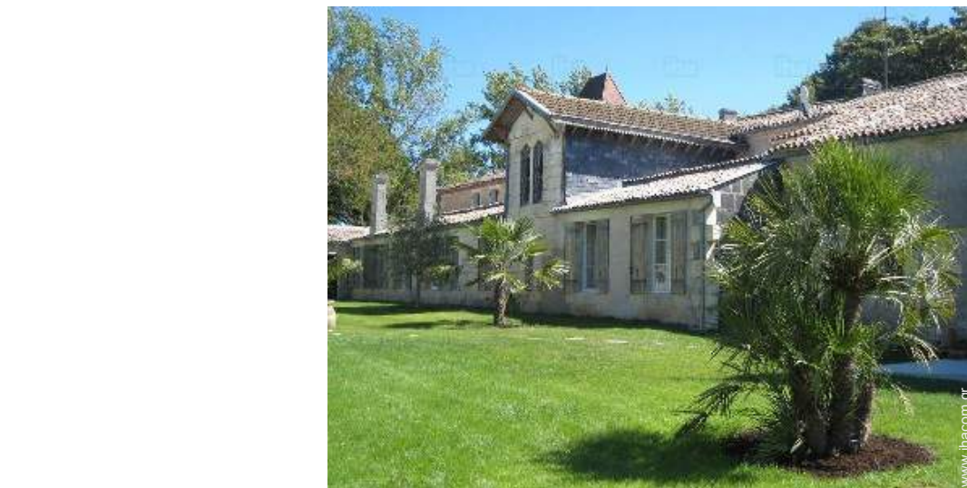
άποψη της ιδιοκτησίας